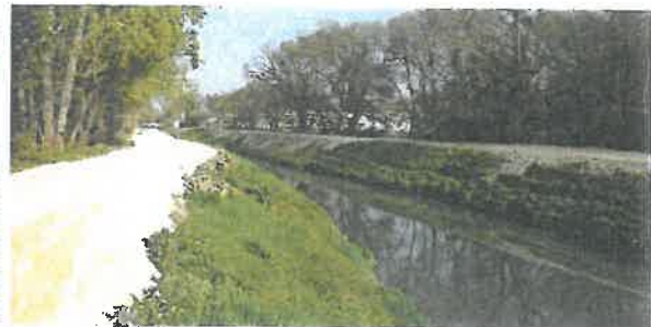
Nivellement de berges à Saint Etienne du Grès