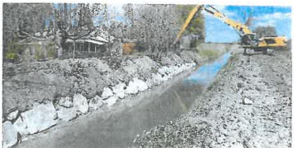
Confortement de berge à Maillane