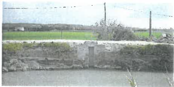
Remplacement d'une vanne « martelière » à Fontvieille