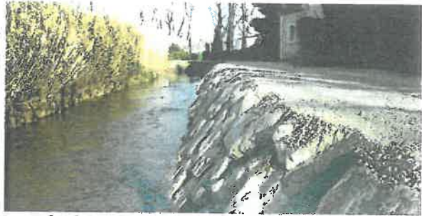
Confortement de berge à Saint Rémy de Provence