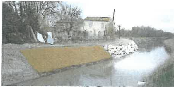
Confortement de berge à Saint Etienne du Grès