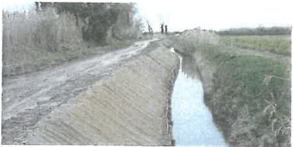
Confortement de berge à Tarascon