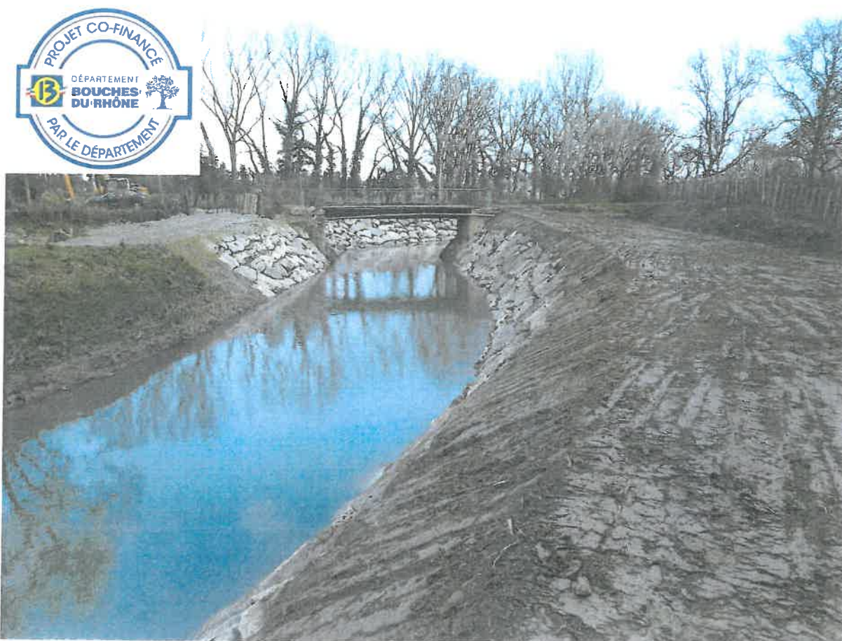
Travaux achevés le 28/01/2020

Le montant total de cette opération s'élève à 112 078,50 € H.T financée à 40% par le Département des Bouches du Rhône, 20% par la Région Provence-Alpes-Côte d'Azur, et 40% par la commune de Saint Etienne du Grès.