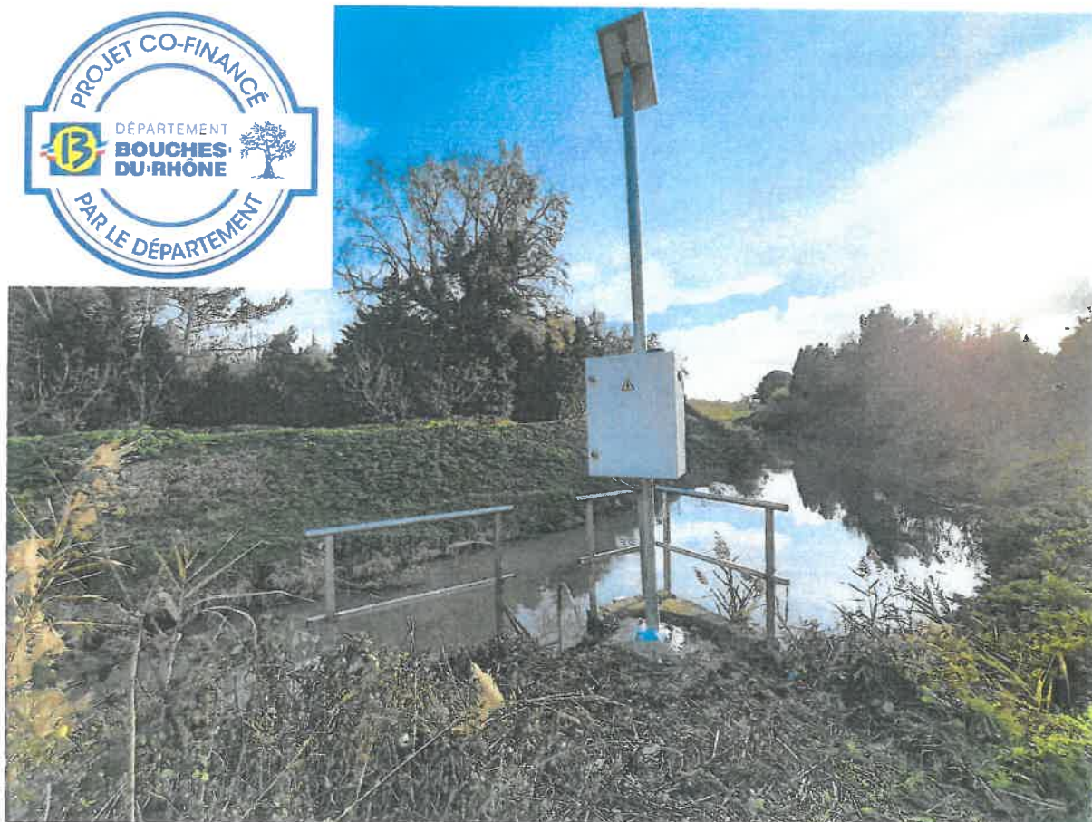
Travaux achevés le 16/12/2020

Le montant total de cette opération s'élève à 10 160,00 € H.T financée à 40% par le Département des Bouches du Rhône, 30% par la Région Provence-Alpes-Côte d'Azur, et 30% par la commune de Tarascon.