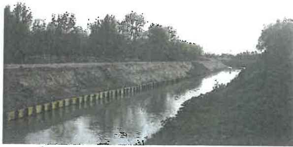
Confortement de berge à Saint Etienne du Grès