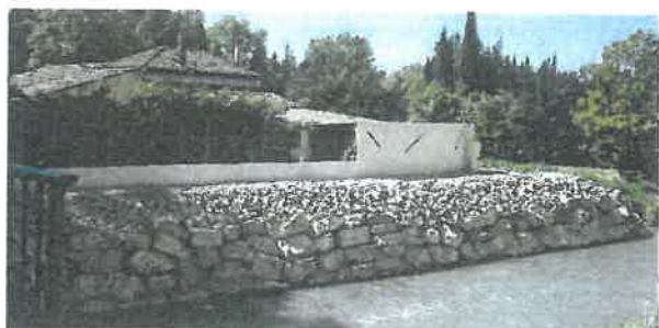
Confortement de berges à Saint Etienne du Grès