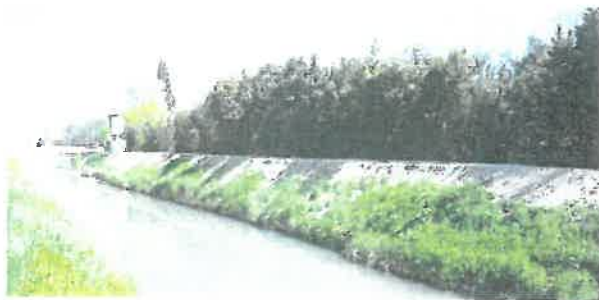
Nivellement de berge à Tarascon