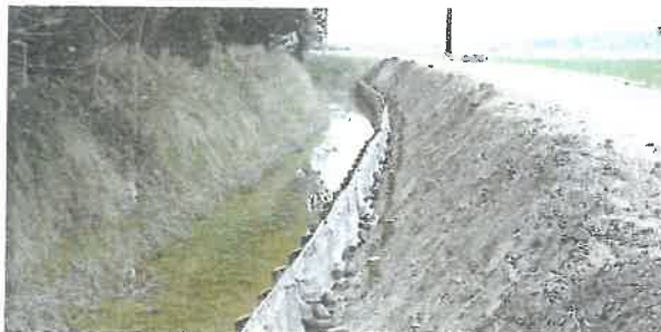
Confortement de berge à Tarascon