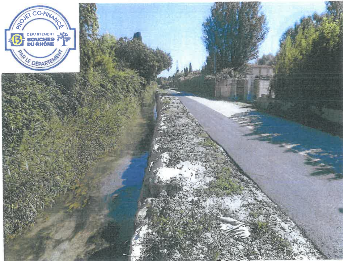
Travaux achevés le 23/07/2020