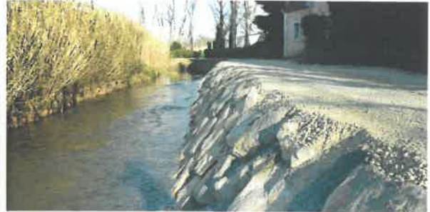
Confortement de berge à Saint Rémy de Provence