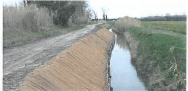
Confortement de berge à Tarascon