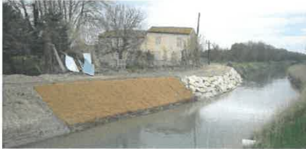
Confortement de berge à Saint Etienne du Grès