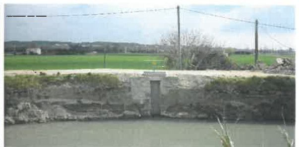
Remplacement d'une vanne « martelière » à Fontvieille