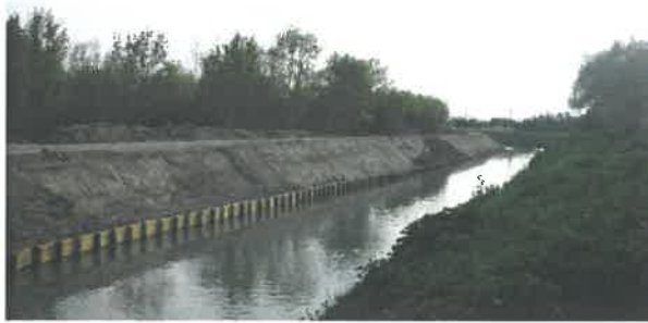
Confortement de berge à Saint Etienne du Grès