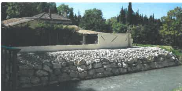
Confortement de berges à Saint Etienne du Grès