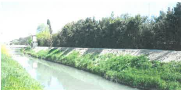
Nivellement de berge à Tarascon