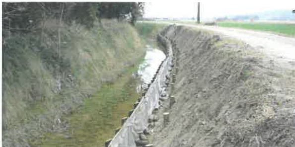
Confortement de berge à Tarascon