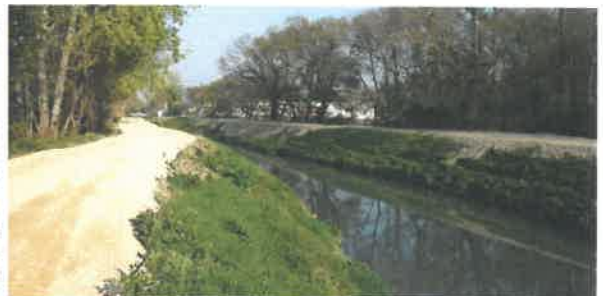
Nivellement de berges à Saint Etienne du Grès