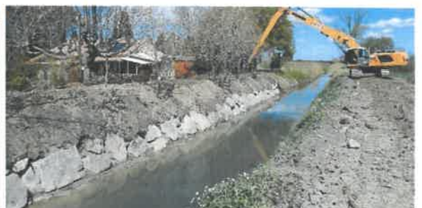
Confortement de berge à Maillane