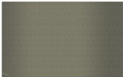
Peinture pour l'ouvrage ton brun mat RAL 7006 beige gris

Un échantillon des couleurs par matériau -avec la correspondance des RAL – sera à fournir au dossier de permis de construire.