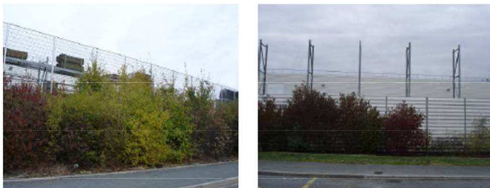
Exemple d'aires de stockage dissimulées derrière des haies

Les espaces de stockage à l'air libre, dans le cas où l'activité implantée le nécessite, devront être gérés à l'arrière du bâtiment (sauf contrainte majeure). Afin d'assurer la bonne organisation de ces espaces, il est imposé de localiser les espaces de stockage sur les plans du permis de construire, complété d'un projet paysager. Si l'entreprise est productrice de déchets d'activités économiques, il est également imposé de localiser sur les plans du permis de construire, la zone réservée à cet effet et les éléments de sa composition. De manière identique aux zones de stockage, les espaces réservés aux déchets et à leur tri doivent être masqués visuellement par des haies végétales.